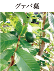
グアバ葉 消化管内で糖を分解する酵素の働きを止める、グアバ葉ポリフェノール含有