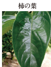
柿の葉 活性酸素を除去するタンニン、動脈硬化を予防するフラボノイドが血管強化