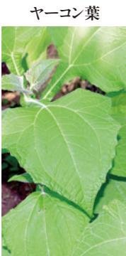
ヤーコン葉 「植物インスリン」と呼ばれ、体内のインスリン分泌を活性化させる働き