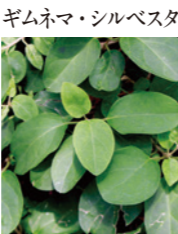
ギムネマ・シルベスタ 主成分のギムネマ酸が、腸内での糖の吸収をブロック。余分な糖を排出