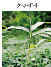
クマザサ 「緑の血液」と呼ばれるクロロフィルが、コレステロールを吸着し血流改善