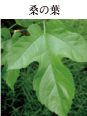
桑の葉 独自成分のDNJがα-グルコシダーゼの働きを弱め、血糖値上昇を抑制