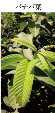
バナバ葉 体内で糖を効率よく消費させる、インスリンに似た成分の「コリン」酸含有

また、糖尿病の数値が改善すれば肥満の解消も期待できます。「体重や腹囲のサイズまで減少した」という声も多く届いています。