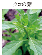
ココの葉 毛細血管の詰まりを防ぐルチン、血液中の塩分排出を促すカリウムを含む